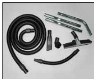
für WS 200