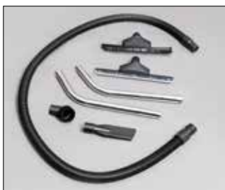
für WS 100